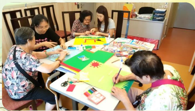
一同製作相架掛飾